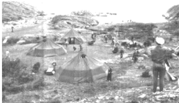
Bilden från ett av alla Pinstläger som varit på Brännö.