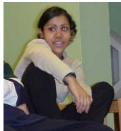
en säker tjej.....

Om ni finner bilderna frånstötande, kontakta Red. för att få egna kopior.