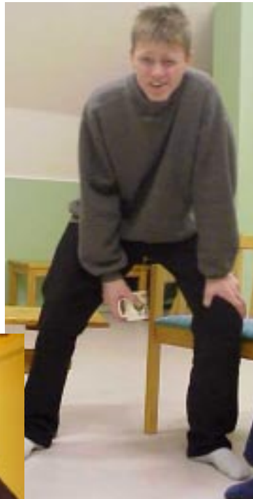
Men visst måste det komma ett helt glas, vaför görs det annars reklam där den fyller ut ett glas???