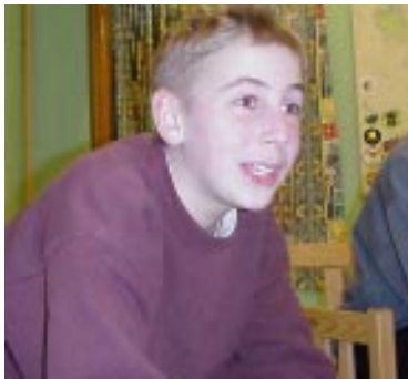
Nasse lär sig, av de äldre