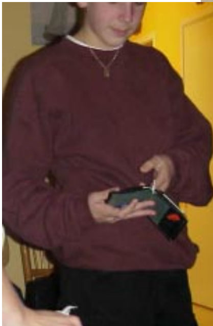
sist men inte minst... HA MED DEM även första gången....

Om ni finner bilderna frånstötande, kontakta Red. för att få egna kopior.