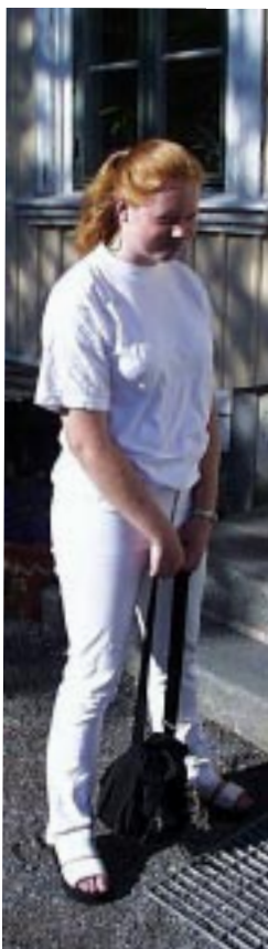
Senior på PINGST