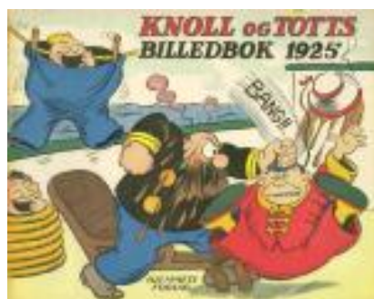
Busiga killar ombord

serier i förskott. Dirks bröt då med tidningen och tog sin ledighet.