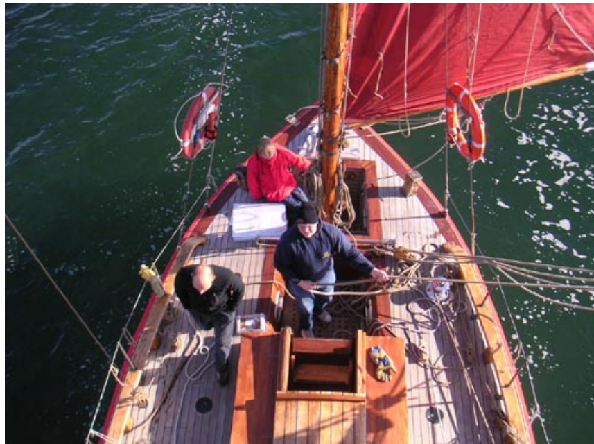
Här seglar Mandalay

Det är cirka trettio skutor från hela norden med på tävlingen. Mandalay som vi seglar med är ju inte så stor som de andra båtarna men vi har roligt ändå. Alla är ganska snälla fast dom brukar kasta vatten ballonger på oss för att vi är minst. För två år sedan var jag också med på tävlingen och då var vi i Norge. När vi skulle åka tillbaka till Sverige skulle vi ge igen för alla kastade vattenballonger, så vi gick bort med en massa vattenballonger gömda i en handduk. Vi kastade iväg ballongerna mot en annan besättning och skulle springa därifrån... Men jag glömde handduken och höll på att bli i slängd men jag lipade lite över mina kassa knän så de släppte mig. Puh vilken tur. Så i år skall jag akta mig för de stora killarna.