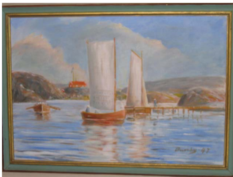
Brännö 1947. De flinka sjöscouterna tränar inför kommande seglingstävlingar.